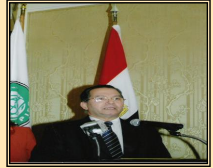
الأستاذ الدكتور / احمد جويلي أمين عام مجلس الوحدة الاقتصادية العربية

الكبيرة التي شهدتها الوطن العربي والتي ستساهم بشكل كبير في زيادة التجارة والاستثمارات بين الدول العربية. وأوضح معاليه ان ١٧ دولة عربية تتبادل السلع بينها في هذه المنطقة بدون جمارك أما الدول الخمس الاخرى الاقل نموا فقد تم اعطاؤها فرصة لتنظيم أوضاعها والانضمام للمنطقة في عام ٢٠١٠. وان مجلس الوحدة الاقتصادية العربية وضع مخططا لاقامة الاتحاد الاقتصادي العربي بحلول عام ٢٠٢٠ من خلال سلسلة من الخطوات المتلاحقة بدأت بمنطقة التجارة الحرة يليها اقامة الاتحاد الجمركي العربي عام ٢٠٠٩ ثم السوق العربية المشتركة في ٢٠١٥ وأخيرا الاتحاد الاقتصادي العرب عام ٢٠٢٠ من خلال اقامة سياسات نقدية واحدة وبنك مركزي عربي واحد وعملة عربية موحدة. وحذر د. جويلي من تعرض أسعار البترول لهزات عنيفة في ظل اعتماد الاقتصاديات العربية في قطاع الصادرات على النفط والتي تصل الى ٧٠ في المائة من حجم الصادرات مع العالم الخارجي. وان الدول العربية تواجه سلسلة من القضايا الحرجة منها "الغذاء والزراعة والمياه" وهي مسألة هامة للغاية نظرا لخطورة اعتماد العالم العربي في الغذاء على العالم الخارجي مشيرا في هذا الإطار الى ان حجم الفجوة الغذائية وصل الان الى ١٧ مليار دولار. وأشار معاليه الى ان العالم العربي يستورد ٧٢ مليون طن من الطعام نصفهم من الحبوب الامر الذي