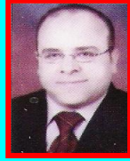
المستشار / حازم موسى نائب رئيس الاتحاد

إذا كان للحضارة وجهان، وجه مادي يتمثل في تقدمها التقني بما يؤدي إليه من منجزات مادية، ووجه ثقافي يعكس قيم الحق والعدل