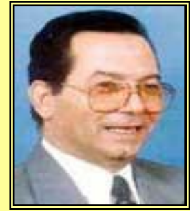
الأستاذ الدكتور / احمد جويلي أمين عام مجلس الوحدة الاقتصادية العربية

حاليا ٢٣ مليون برميل من النفط الخام يوميا، مشيرا إلى أن سعر البرميل وصل إلى أكثر من ٩٠ دولارا. كما أن نسبة إنتاج الدول العربية للنفط الخام مقارنة بدول العالم تصل إلى ٣١.٨ % ، ونسبة إنتاج الدول العربية للغاز الطبيعي مقارنة بالإنتاج العالمي تبلغ ١٢.٥ % والاحتياطي ٢٩.٤ % . وأشار معاليه إلى أن الصادرات السلعية للدول العربية تقدر بحوالي ٦٥٧ مليار دولار والواردات السلعية ٣٥٨.٣ مليار دولار ، موضحا أن الناتج المحلي الإجمالي للدول العربية هو ١٢٧٣٤ مليار دولار ، ومتوسط نصيب الفرد بسعر السوق ٤.١٥٦ دولار ، مشيرا إلى أن الدين العام الخارجي للدول العربية المقترضة هو ١٣٥.٩ مليار دولار . من جانب آخر أكد د. جويلي أهمية القمة الاقتصادية العربية مطلع العام المقبل، مشيرا إلى أن مجلس الوحدة