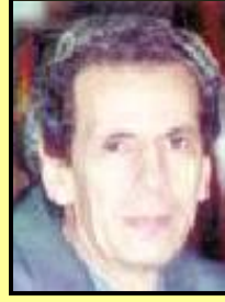
الاستاذ الدكتور / سعد نصار استاذ الاقتصاد الزراعي ومستشار وزير الزراعة واستصلاح الاراضي

بلغت صادرات مصر من الأغذية الطازجة والمصنعة ٩ مليارات جنيه والمستهدف معدل نمو بين ١٥% - ٢٠% سنويا من خلال تشجيع الدولة للاستثمار الزراعي الذي وصلت قيمة استثماراته ٩ مليارات جنيه يمثل القطاع الخاص ٧٥% منها والـ ٢٥% قطاع عام حيث توفر الدولة القروض للمزارعين من خلال بنك التنمية والائتمان الزراعي بشروط ميسرة والتي بلغت ١٨ مليار جنيه